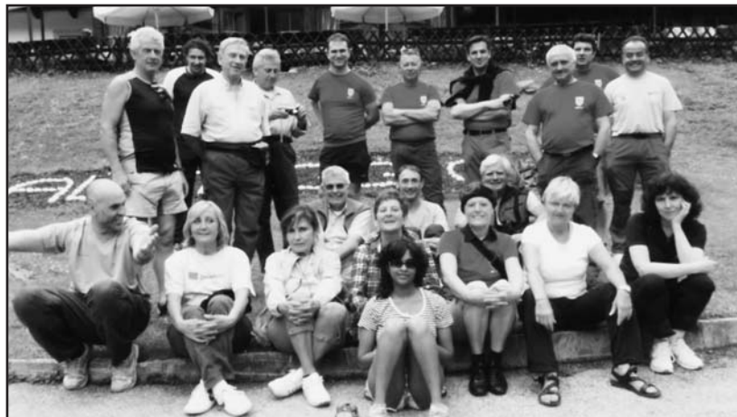
I partecipanti alla gita.

Gruppo del Tessa ed abbiamo goduto dall'alto la vista della vallata al cui centro sorge Merano, allo sbocco della Val Passiria. Si notano l'ippodromo di Maia Bassa e si abbraccia con lo sguardo l'antico Castrum Maiense, fondato forse da Druso verso il 15 a. C., al confine con la Rezia. Spiccano pure la Cattedrale gotica (XIV-XV sec.) ed il Castello del XII°sec.