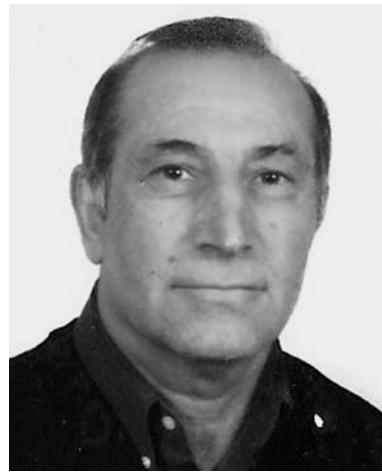
Luigi Cherubini 1° anniversario