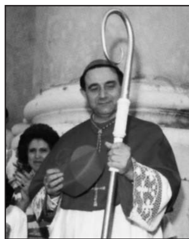
Il saluto al neo Vescovo mons. Olmi.

Gli auguri da parte di tutta la redazione dell'Eco, anche per gli 83 anni che mons. Olmi compirà il 14 di agosto, il giorno prima della solenne celebrazione.