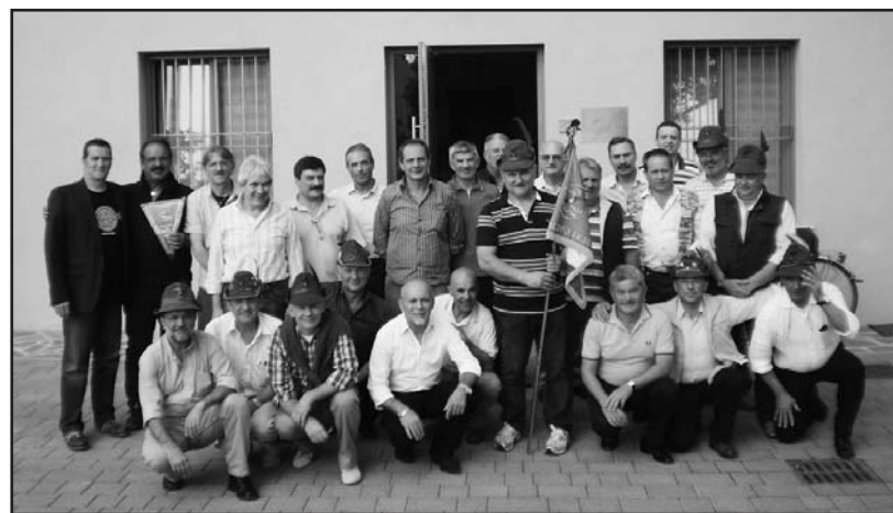
I commilitoni davanti alla sede degli Alpini.

Il raduno si è svolto presso la sede degli Alpini di Montichiari che hanno ricevuto i ringraziamenti ed i complimenti dai commilitoni del '75, molto soddisfatti del servizio svolto e dell'accoglienza.